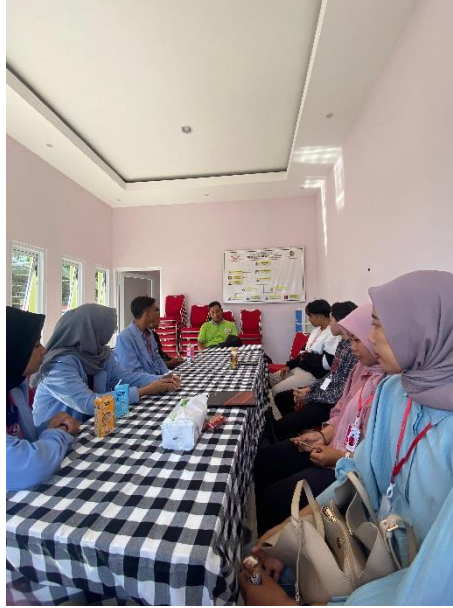
Gambar 8. Sharing Dengan Pengurus BUMDES