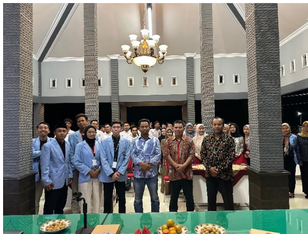
Gambar 16. Sosialisasi UU ITE di Balai Desa Bangunjaya

Kegiatan Sosialisasi Terkait UU ITE Dengan Narasumber Ketua LKBH Universitas Tulungagung dengan tujuan meningkatkan pemahaman masyarakat tentang peraturan yang mengatur aktivitas di dunia digital dan transaksi elektronik, sehingga mereka lebih paham akan hak dan kewajiban mereka. Undang-Undang ITE adalah undang-undang di Indonesia yang mengatur tentang penggunaan teknologi informasi dan transaksi elektronik. Undang-undang ini ditujukan untuk mengatur kegiatan yang berkaitan dengan penggunaan internet, komputer, dan perangkat elektronik lainnya. UU ITE pertama kali diundangkan melalui UU No. 11 Tahun 2008 dan kemudian mengalami revisi dengan UU No. 19 Tahun 2016. Sosialisasi ini dihadiri oleh perangkat desa serta Karang Taruna Desa Bangunjaya. Dalam kegiatan tersebut dipaparkan materi berupa pengertian, jenis, dan regulasi mengenai UU ITE. Dengan Ketua LKBH Universitas Tulungagung juga menghimbau agar masyarakat lebih berhati-hati dalam menggunakan media online. Ditutup dengan sesi tanya jawab dari audien Sosialisasi UU ITE.