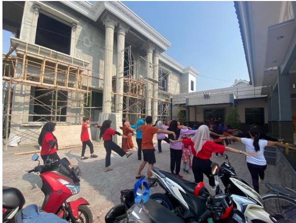
Gambar 17. Senam Sehat Bersama Ibu-Ibu Desa Bangunjaya

Mengikuti senam sehat rutin pada hari minggu bersama ibu-ibu desa bangunjaya kegiatan senam dilaksanakan pukul 08.00 sampai selesai di desa bangunjaya bertempat di halaman balai desa bangunjaya, dengan adanya kegiatan ini bisa mengajak para ibu-ibu untuk berolahraga. senam ini juga membawa beragam manfaatnya yaitu bisa membantu meningkatkan kerja jantung,. Selain itu, senam secara rutin juga bisa membantu melawan radikal bebas dalam tubuh, sehingga bisa membantu meningkatkan sistem kekebalan tubuh.