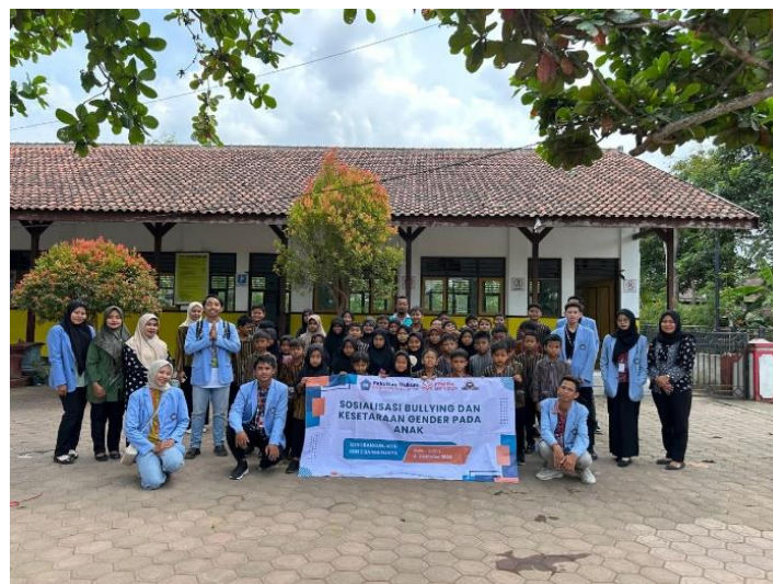
Gambar 7. Sosialisasi di SDN 2 Bangunjaya