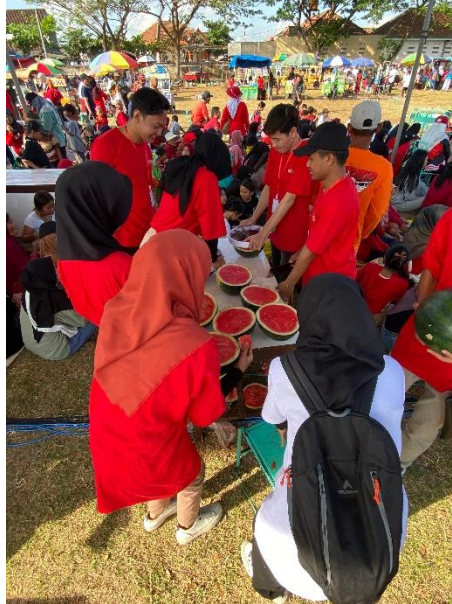
Gambar 11. Pematangan Semangka Yang Akan Dibagikan Kepada Peserta Jalan Sehat

Pada hari Minggu Mahasiswa PPM mengikuti jalan sehat dan ikut mempersiapkan semangka untuk dibagikan kepada peserta jalan sehat, didalam harinya Mahasiswa PPM menyaksikan puncak acara yaitu pagelaran seni Campursari Guyon Maton Cak Percil CS.