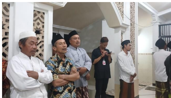
Gambar 3. Pelaksanaan Peringatan Maulid Nabi Muhammad SAW