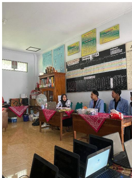
Gambar 5. Kunjungan Ke SDN 2 Bangunjaya

Dengan dilakukan kedua kunjungan tersebut, maka guru serta siswa-siswi yang ada di SDN 1 Bangunjaya, SDN 2 Bangunjaya, dan Kelompok 1 PPM Universitas Tulungagung dapat saling mengenal satu sama lain.