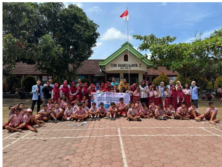
Gambar 6. Sosialisasi di SDN 1 Bangunjaya

telah disiapkan sebelumnya. Hasil yang akan dicapai setelah pelaksanaan program ini adalah murid Sekolah Dasar Negeri 1 dan 2 Desa Bangunjaya mengetahui tentang bahaya perbuatan Bullying yang terjadi di dalam kehidupan baik di lingkungan sekolah maupun di lingkungan masyarakat luar dan paham tentang kesetaraan gender. Juga kerjasama dalam pengawasan dari orangtua ketika bermain di rumah dan pengawasan bermain dan belajar di sekolah oleh para guru dan warga sekolah lainnya sangat diperlukan.