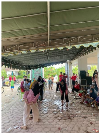
Gambar 1. Pelaksanaan Lomba

Kegiatan ini dimulai dengan sambutan ketua PPM untuk menyampaikan mengenai lomba-lomba yang akan diselenggarakan. Peserta lomba dari santri TPQ Bustanul Ulum Desa Bangunjaya.