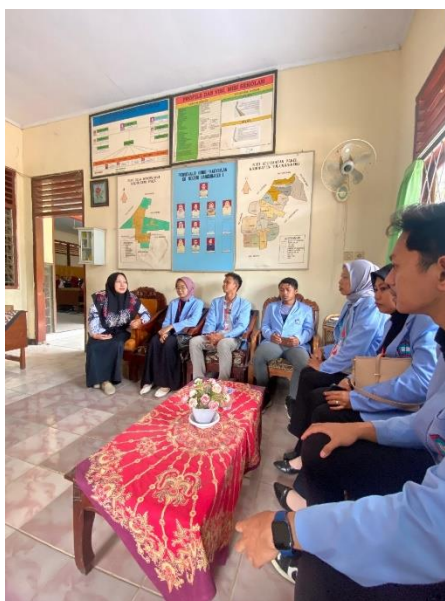
Gambar 4. Kunjungan Ke SDN 1 Bangunjaya

Mahasiswa PPM Universitas Tulungagung melakukan Kunjungan ke SDN 1 Bangunjaya dan SDN 2 Bangunjaya pada tanggal 25 September 2024. Kunjungan ini dilakukan untuk mengetahui secara langsung kondisi SDN 1 Bangunjaya dan SDN 2 Bangunjaya sebelum diadakannya sosialisasi pada kegiatan program kerja mahasiswa PPM Universitas Tulungagung. Kunjungan pertama dilaksanakan di SDN 1 Bangunjaya. Awal kunjungan didahului dengan tujuan Ruang Kepala Sekolah guna menghadap Kepala SDN 1 Bangunjaya. Kedatangan mahasiswa PPM dari kelompok 1 ini disambut hangat oleh Kepala Sekolah, Bapak dan Ibu Guru, serta seluruh Siswa-Siswi SDN 1 Bangunjaya.