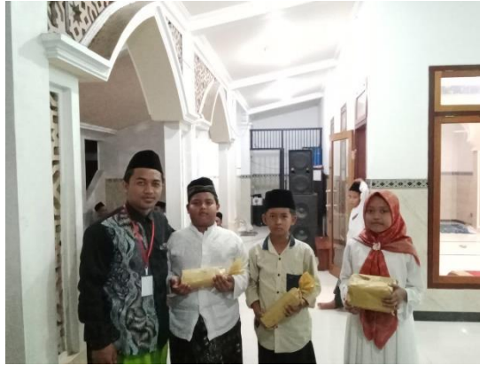
Gambar 2. Penyerahan Hadiah Kepada Pemenang Lomba

Penyerahan hadiah dilaksanakan pada malam hari serta mengikuti acara peringatan Maulid Nabi Muhammad SAW yang dilaksanakan oleh pengurus dan warga sekitar Masjid Bustanul Ulum Desa Bangunjaya.