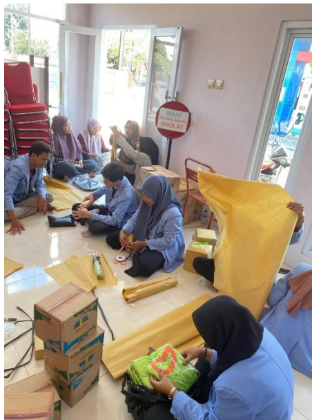
Gambar 10. Pembungkusan Doorprize Jalan Sehat

Pada kesempatan ini, Mahasiswa PPM kelompok 1 diberi arahan oleh Kepala Desa Bangunjaya, untuk mengikuti acara PHBN dan ikut mempersiapkan doorprize dengan semua anggota Karang Taruna terkait persiapan pelaksanaan acara.