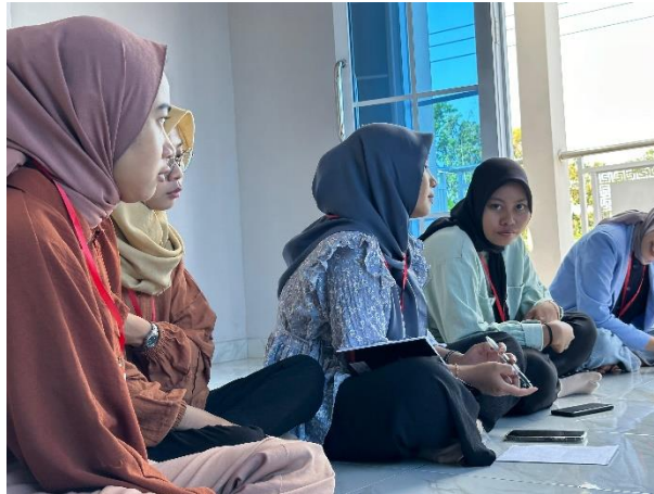
Gambar 9. Sharing Dengan Ketua Karang Taruna