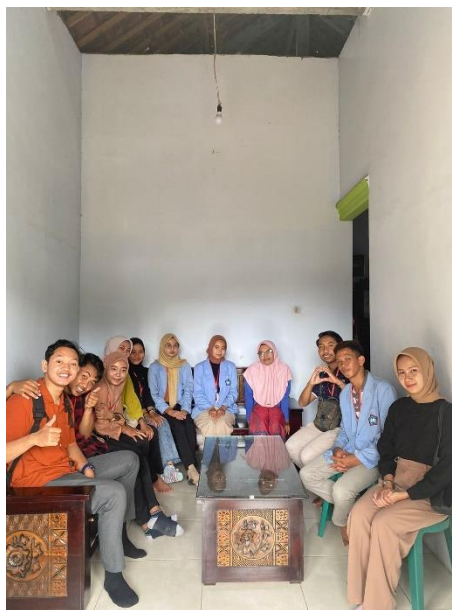
Gambar 13. UMKM Telur Asin