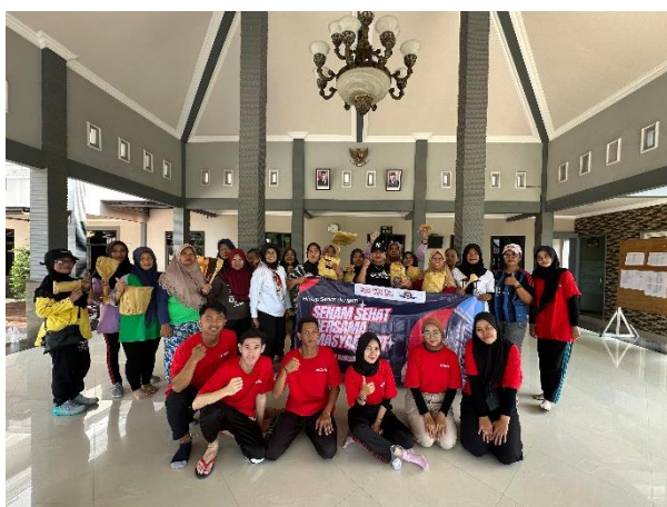
Gambar 18. Pemberian Doorprize Kepada Ibu-Ibu Senam Sehat